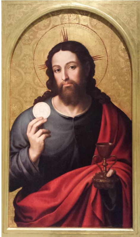
Juan de Juanes. Salvador Eucarístico. 1557-1560. Museo S.

1367. El sacrifici del Crist i el sacrifici de l'Eucaristia són un únic sacrifici: “La víctima és una de sola i la mateixa: el que ara s’ofereix pel ministeri dels sacerdots és el mateix que s’oferí a la Creu. Només és diferent la manera d’oferir-se”: “En aquest sacrifici diví, que té lloc en la missa, es conté i s’immola incruentament el mateix Crist que s’oferí un cop de manera cruenta a l’altar de la Creu” (Concili de Trento).