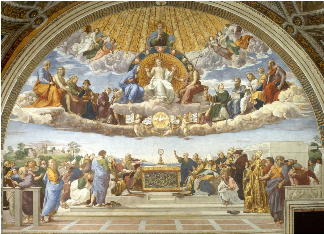
Disputa del Sacramento. Rafael. Vaticano.