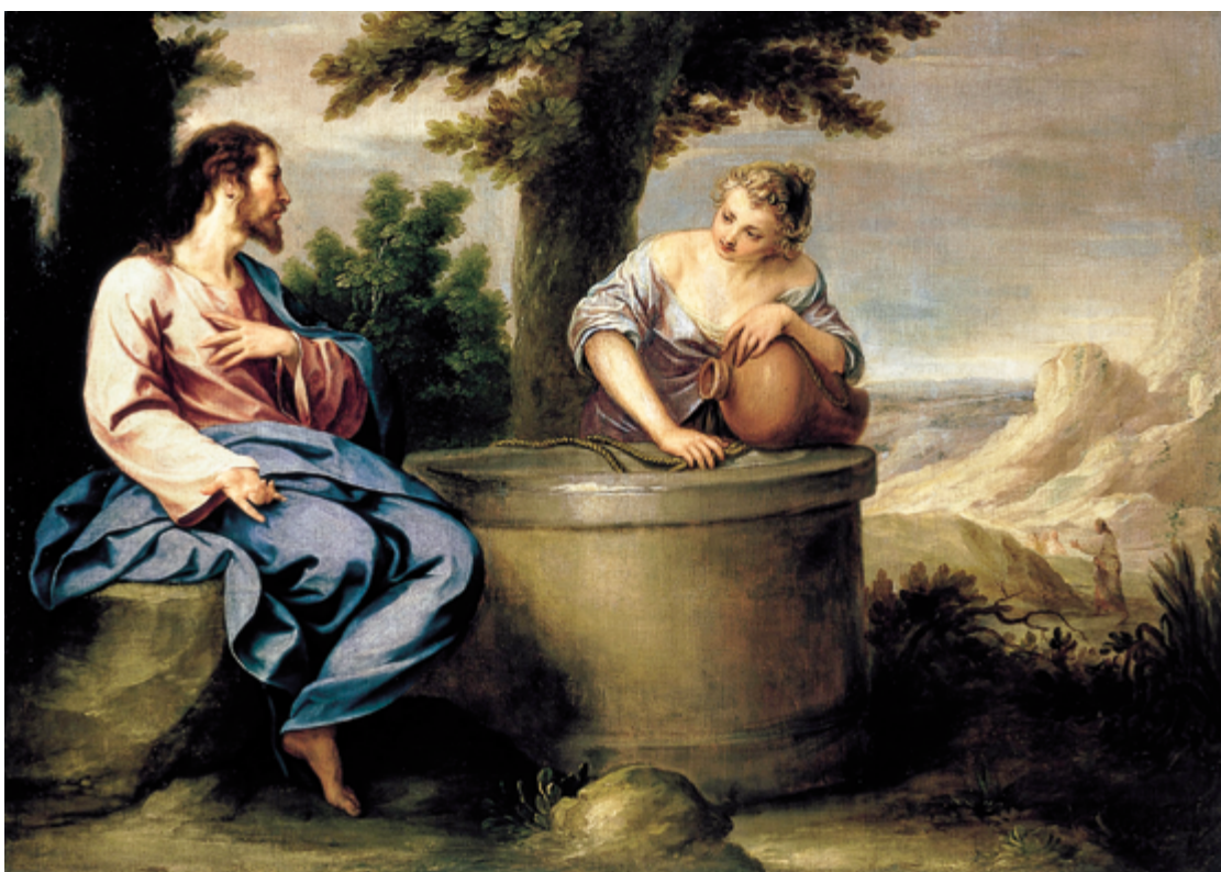
Crist i la samaritana, d'Alonso Cano

Vivim més connectats que mai, podem relacionar-nos amb persones a l'altra banda del planeta, però alhora experimentem moltes dificultats per a la concentració i l'aprofundiment en nosaltres mateixos i en allò que vivim. Estem exposats a un bombardeig d'estímuls constant, la dispersió és un dels mals que afecten a molts avui dia i evidentment, aquest ambient no és gens propici al silenci i a la pregària. I aquest aspecte de la pregària és un dels elements essencials per a la vida cristiana i que se'ns proposa especialment en el temps de Quaresma.